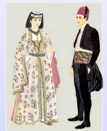
Bosnian kansallispuku Bosanska narodna nošnja