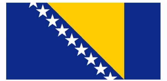
Bosnia-Hertsegovinan lippu Zastava Bosne i Hercegovine