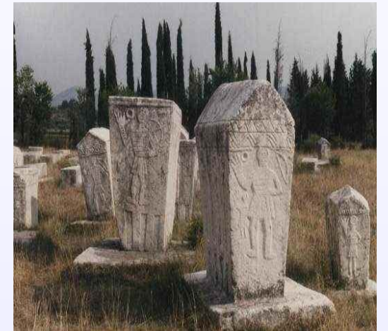
Stećci-hautakiviä keskiajalta Stećci-nagrobni spomenici iz srednjeg vijeka

A a B b C c Č č Ć ć D d Đ đ E e F f G g H h I i J j K k L l Lj lj M m N n Nj nj O o P p R r S s Š š T t U u V v Z z Ž ž